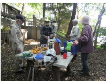
休憩時のカキの差し入れ