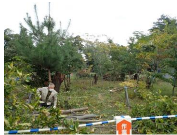
アカメガシワや松の間伐