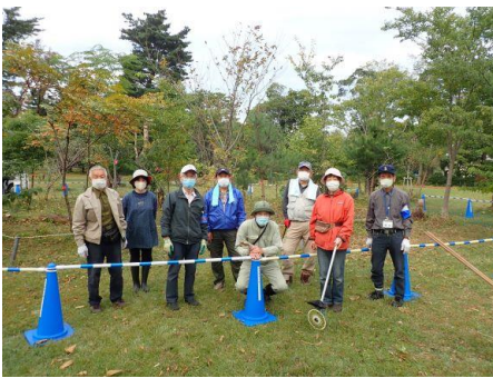
森の整備の無事終了記念