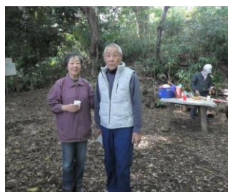
神杉氏が立ち寄って下さいました