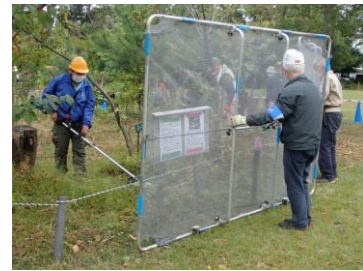
草刈り機使用中のフェンス使用